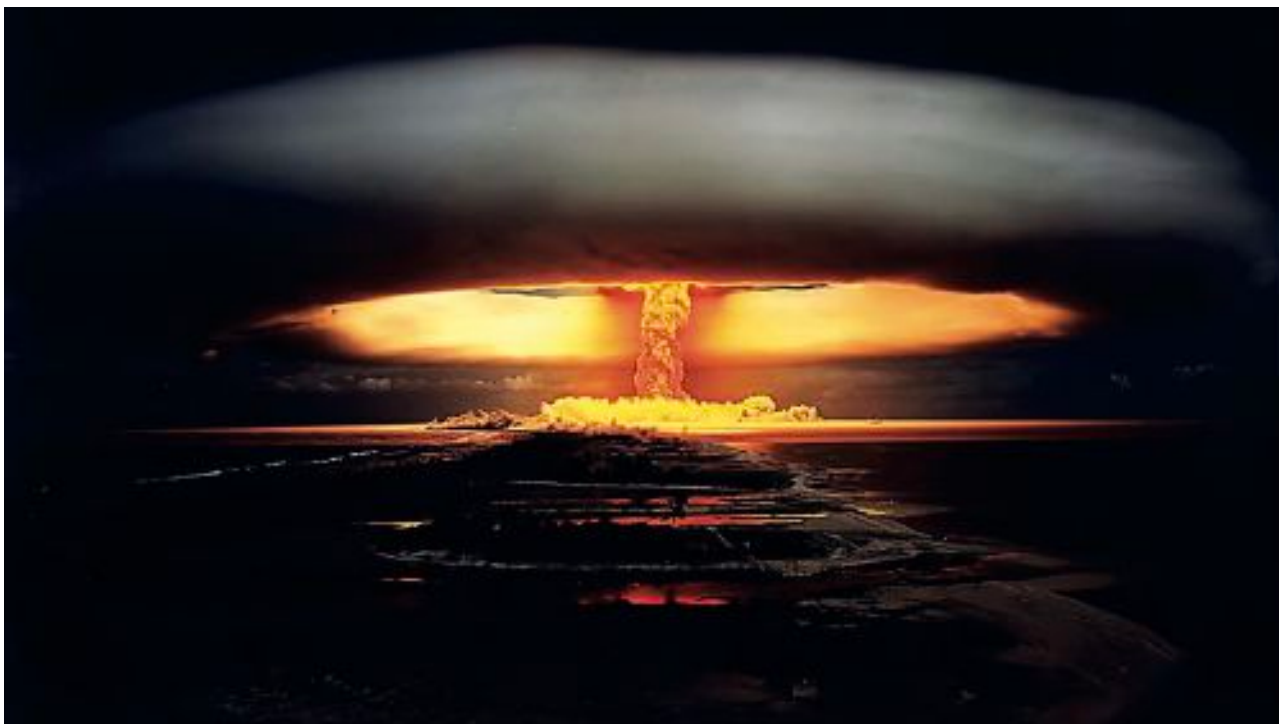
Franse kernexplosie op het Moruroa atol, Licorne (Eenhoorn) test, op 3 juli 1970

Dit artikel is gepubliceerd in het herfstnummer 2023 van New View Magazine. Voor meer informatie over New View en om u te abonneren: https://www.newview.org.uk/