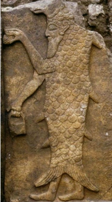
EA bron Wikipedia

dat onder het harde minerale ijskristalveld doorstroomt en het was een perfect beeld voor Steenbok. In Steenbok hebben we deze combinatie van de hoorns en hoeven van de geit, dat wezen dat thuis is in het minerale rotsachtige rijk en de staart van de vis, dat een wezen is dat thuis is in het waterige etherische element. In die zin kunnen we dit feest zien als deze strijd van levenskrachten ten opzichte van de verhardende krachten van de mineralisatie, zowel in de natuur als in ons bewustzijn. Zowel in het noorden als in het zuiden zou men op deze manier naar dit festival kunnen kijken, of de Moeder nieuw leven moet voortbrengen uit het koude minerale aardrijk of dat het levensrijk het sterven in het koude minerale rijk van de herfst aarde moet binnengaan en overleven. Dit is de essentie van de Steenbok verbeelding en van de diepere spirituele betekenis ervan.