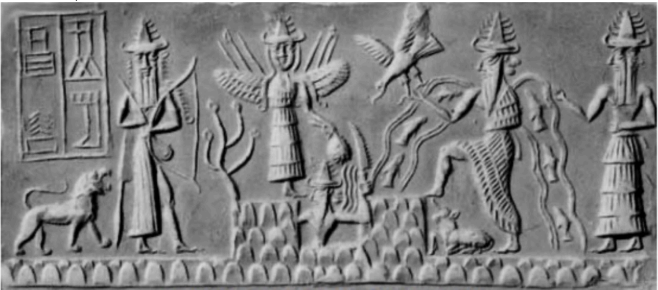
ENKI

Dit wordt nog duidelijker wanneer we de mythologische verhalen uit het verleden bestuderen die met Steenbok worden geassocieerd. Zij voeren ons allen terug naar deze confrontatie van de zich verhardende krachten in relatie tot de stromende spirituele bronnen van het leven. Zelfs zo ver terug als de vroege Chaldeeuwse mythen, wordt Steenbok geassocieerd met de god, Ea, (wiens Sumerische equivalent Enki was). Deze god werd vaak voorgesteld met een gehoornde kop, maar wiens lichaam omgeven was door een stromende rivier waarin vissen zwommen. Hij verblijft in de oceaan van het leven die abzu werd genoemd, en die zich onder het oppervlak van de minerale aarde bevindt. Babylon zou gebouwd zijn op de top van de abzu, de levende wateren. Ea is ook de beschermer van de mensheid die in de Babylonische vloedmythe een wijze genaamd Atrahasis oproeg een ark te bouwen, zodat de mensheid aan de vernietiging kon ontsnappen.