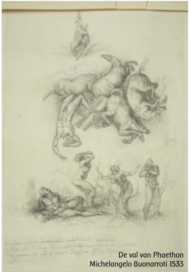
De val van Phaethon Michelangelo Buonarroti 1533

taak was alleen weggelegd voor hem, de god Helios. Helaas, als de goden eenmaal een gunst hadden beloofd, konden zij die niet meer intrekken of ontkennen. Helios gebruikte al zijn overredingskracht om de onbezonnen Phaethon te smeken zijn buitensporige eis in te trekken, maar het mocht niet baten. De jongen stond erop dat Helios zijn belofte zou houden. De god van de zon kon niets anders doen dan toegeven. Helios probeerde zijn zoon te waarschuwen voor de gevaren van het besturen van de wagen met zijn vurige paarden, die zelfs de grote god zelf bij vele gelegenheden moeilijk onder controle te houden had. Zodra Phaethon opsteeg, beseftte hij dat hij meer op zich had genomen dan hij aankon. Hij vond zichzelf volkomen machteloos om de vurige paarden in bedwang te houden. Toen de paarden de zwakte en de onervarenheid van hun jonge wagenmenner bespeurden, begonnen zij een wilde en gevaarlijke koers te volgen. De strijdswagen van de zon zou een gat in de hemel geslagen hebben dat de Melkweg zou zijn geworden, een spiraalvormig sterrenstelsel. Toen begon de oncontroleerbare wagen met de zon een te lage koers te varen, waarbij hij de aarde raakte en immense verwoestingen aanrichtte, waaronder het verbranden van het Afrikaanse continent en het in woestijn veranderde, waardoor het Ethiopische volk een zwarte huidskleur kreeg, omdat het verbrand was door het vuur van de zon, en waardoor zelfs de rivier de Nijl aanzienlijke schade opliep.