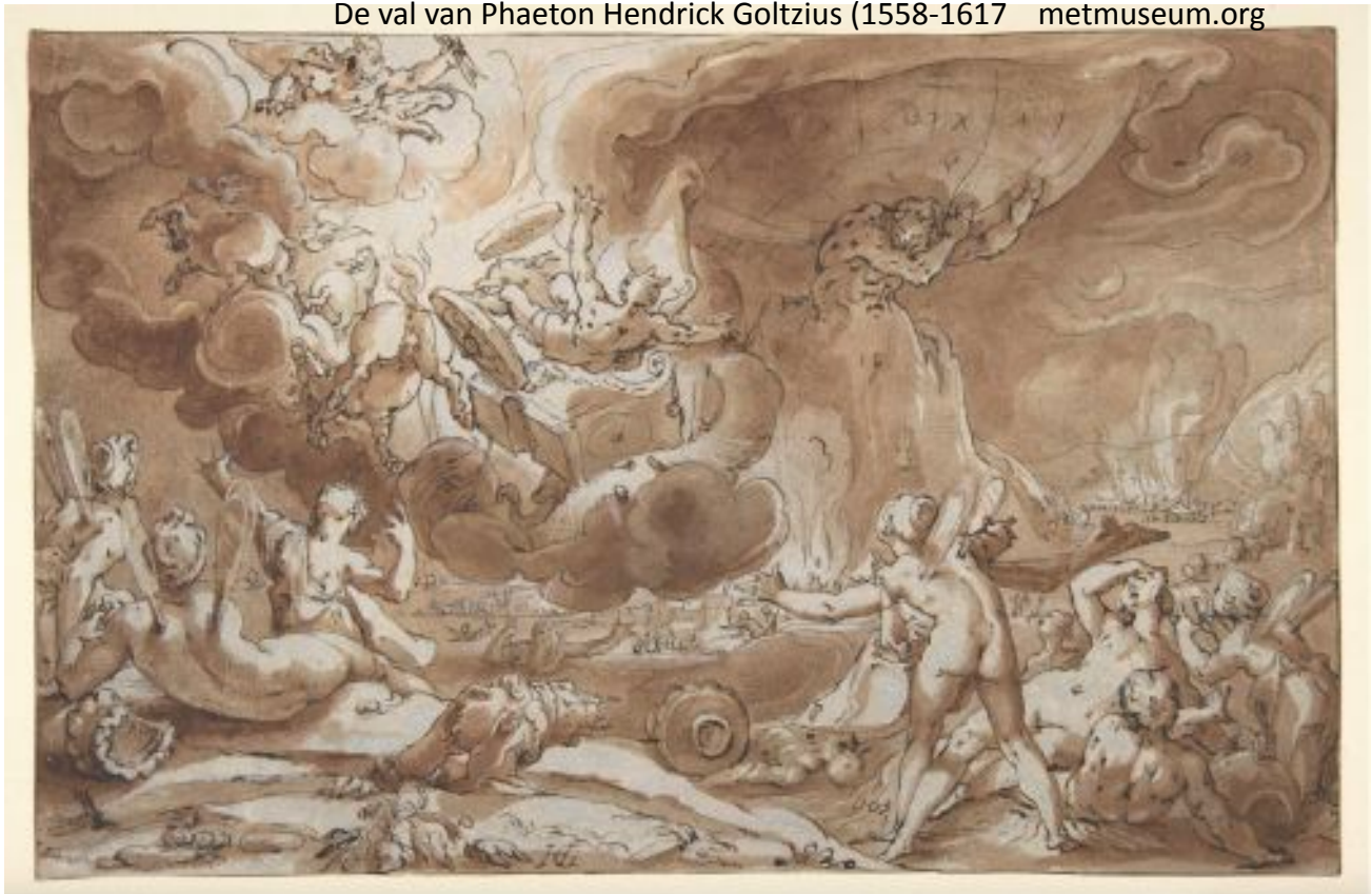
De val van Phaeton Hendrick Goltzius (1558-1617