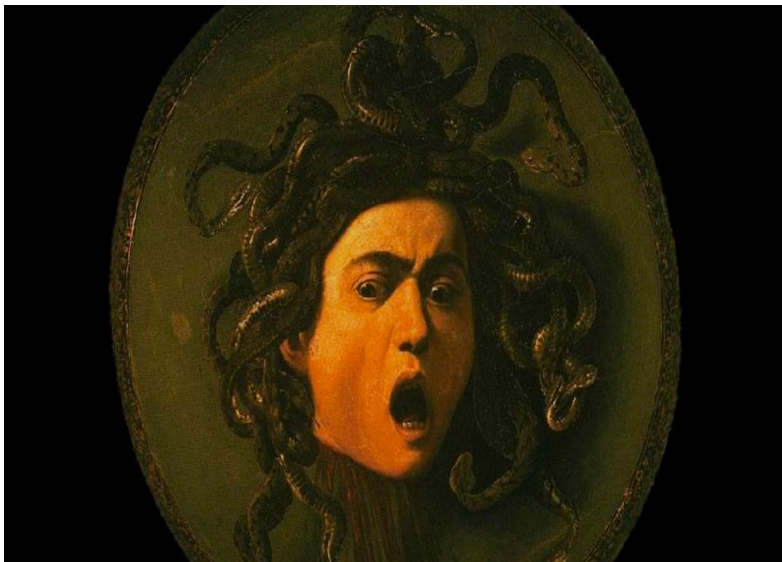
Schilderij van Caravaggio

Dus, laten we de verbeelding voor deze eclips verder opbouwen. We hebben nu het beeld van de maansverduistering als het toelaten van kwade gedachten in de kosmos om naar de mens te stromen. We hebben het beeld van de maansknopen en de draak, en deze verduistering vindt plaats in de zuidelijke of dalende knoop, de staart van de draak, die de niet-getransformeerde krachten van karma uit het verleden met zich meedraagt. De maan wordt verduisterd in de sterren van Weegschaal, de sterren van Michaël, de drempel tussen het hogere en lagere in ons. De zon wordt geblokkeerd door de aarde die direct tussen zon en maan doorgaat om de verduistering tot stand te brengen, en staat juist in het begin van de sterren van Stier, het sterrenbeeld van het Woord in zijn macrokosmische aspect. Maar belangrijk voor dit artikel en de eclips is dat de zon conjunct staat in de lengterichting (op 1 o afstand) van een ster boven Stier in het sterrenbeeld Perseus (een Michaëlsfiguur). Het is de ster Algol, die oog of voorhoofd van Medusa is. Wij kennen het verhaal van Medusa, een mooie gorgon maagd die een duister wezen werd, met slangen als haar en wier blik zo angstaanjagend was dat zij allen die naar haar keken in steen veranderde. In de Ilias wordt zij beschreven als "het hoofd van de Gorgon, een afschuwelijk gezicht, misvormd en afschuwelijk, en een teken van ellende".